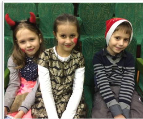
На новогодней программе в ДК «Строитель» и в школе